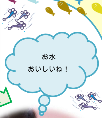
★依頼会員宅での託児★ (今日は児童館におでかけ)