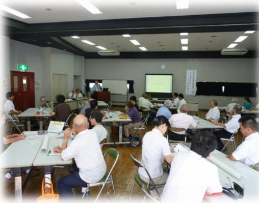
ふれあい学習推進員会研修会