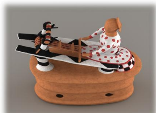
甲塚古墳出土 機織り形埴輪（復元）