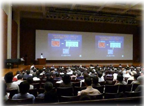
自治医科大学連携講座