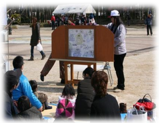
下野薬師寺跡史跡まつり（紙芝居）