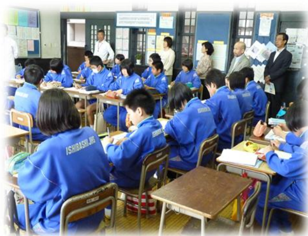
【石橋中学校での授業参観】