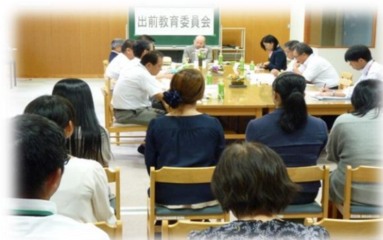
緑小学校で開催された 出前教育委員会