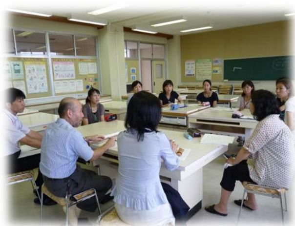
【祇園小学校での教職員との懇談】