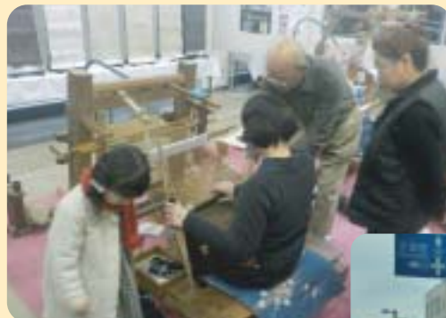
結城紬機織り体験