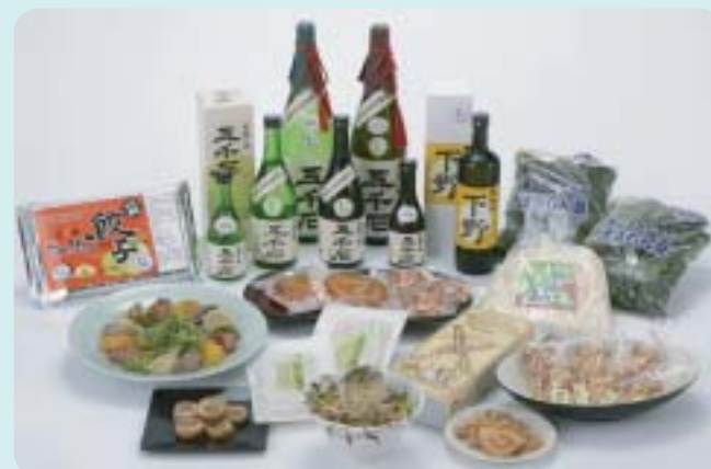
下野ブランド（特産品部門）