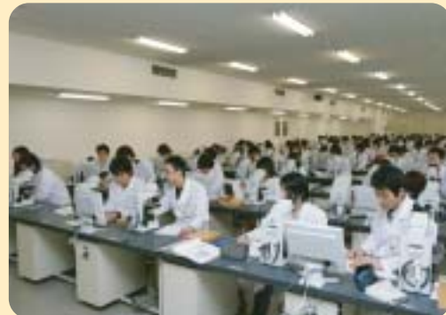
大学での研究授業