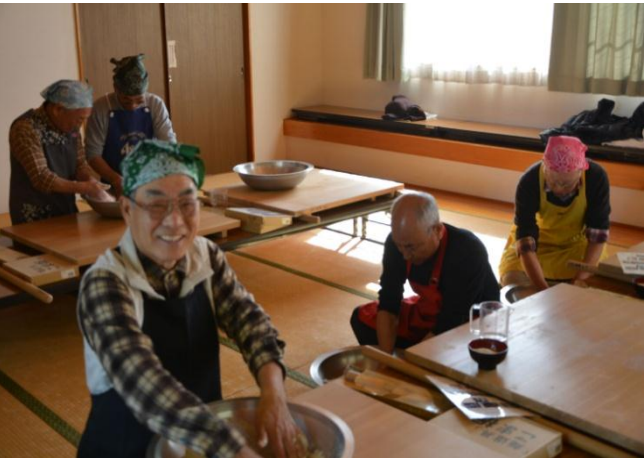
ソバ会『皆でおいしく頂きました』

ソバ会『二八ソバを打ちました』新ソバの時期に次回予定です。初心者も歓迎！ 11月27日