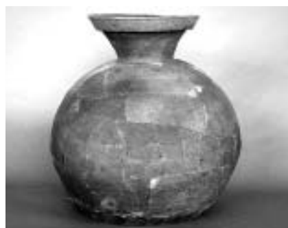
三王山2号墳出土壺形土器