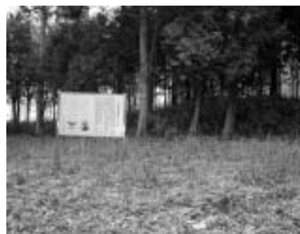
東から見た三王山2号墳