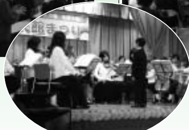
未来の指揮者がタクトをふります！