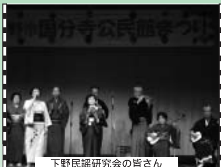
下野民謡研究会の皆さん