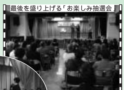
最後を盛り上げる「お楽しみ抽選会」