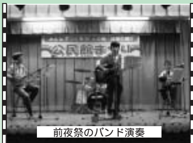
前夜祭のバンド演奏