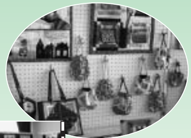
パッチワーク & リフォーム作品