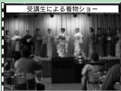
受講生による着物ショー