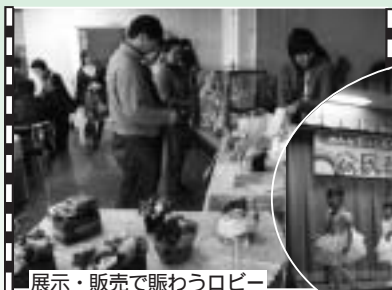
展示・販売で賑わうロビー