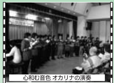
心和む音色 オカリナの演奏