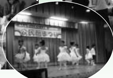
ジュニアバレエの発表