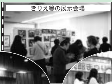
きりえ等の展示会場