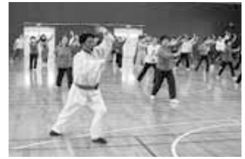
国分寺地区総合型地域 スポーツクラブ気功&太極拳教室

それぞれ、各スポーツクラブは、地域の特性を生かし、工夫を凝らしながら事業運営に取り組んでいます。市民の皆さままで興味をもたれた方、様々な角度からスポーツクラブに携わりたい方は、ぜひご家族やお友達を誘って参加してみてもいかがでしょうか?