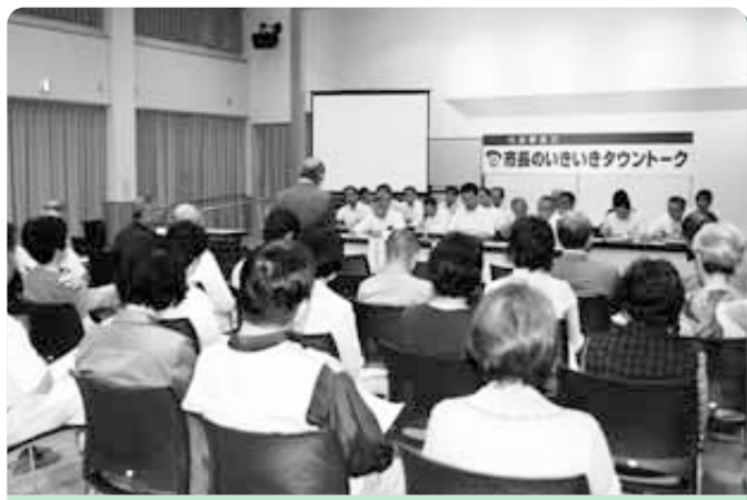
コミュニティセンター友愛館

7月2日(木)から4日(土)にかけて、平成21年度(前期)市政懇談会「市長のいきいきタウントーク」が市内3会場で開催されました。 会場には3日間で延べ95名の市民の皆さんが参加され、市政に対する多くの意見・要望等が述べられました。 各会場での参加人数及び意見・要望等の内訳は下表のとおりです。いただいたご意見・ご要望等は庁内で検討し、今後のまちづくりに活かしていきます。 また、ご意見・ご要望等とそれに対する市の回答の一部を紹介しますが、全ての一覧を総合政策室(国分寺庁舎2階)及び市ホームページでご覧いただけます。