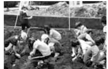
グリムの里スポーツクラブ グリムキッズスクール