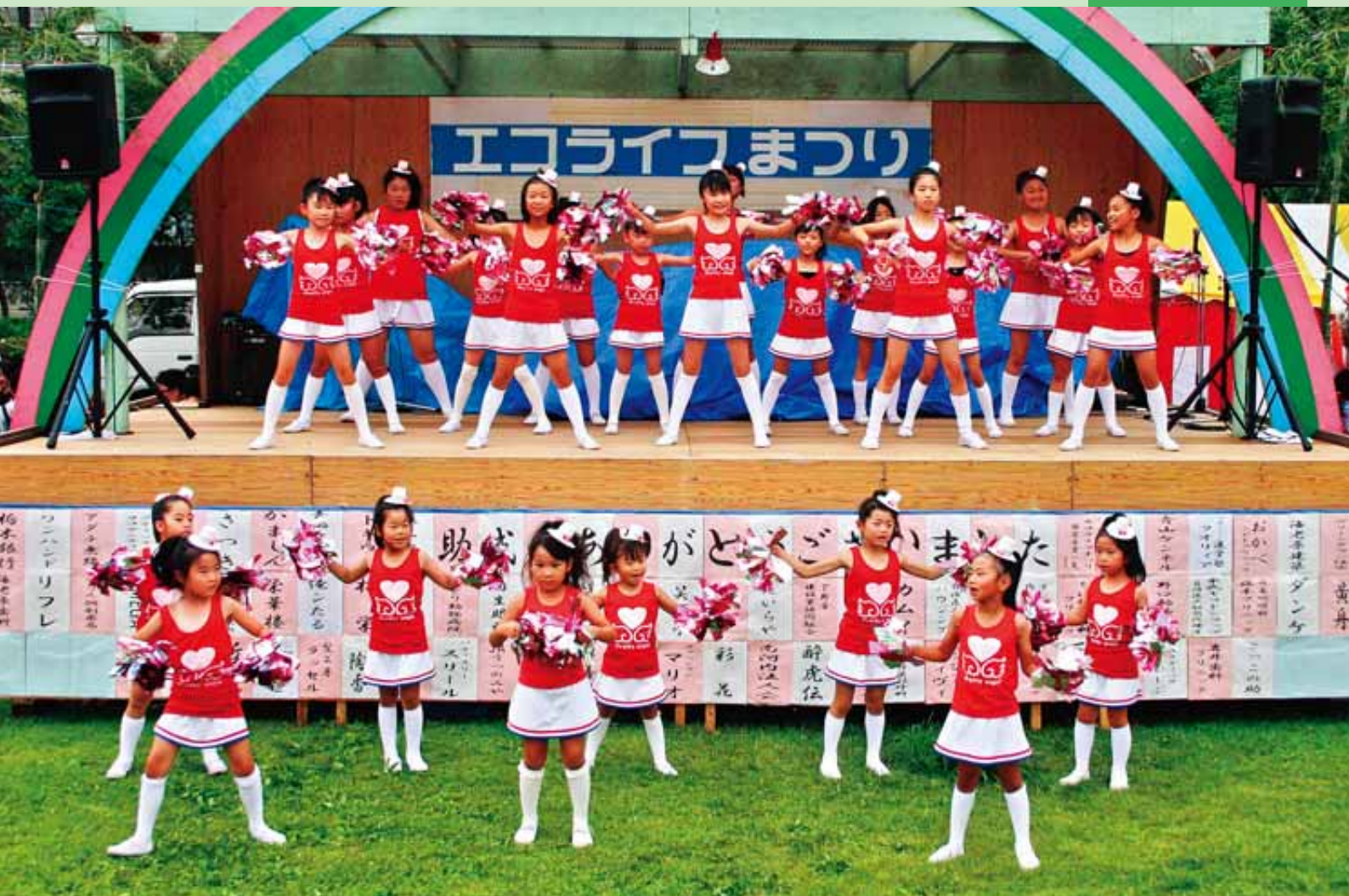
祇園原公園でエコライフ祭りが開催されました