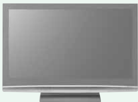
デジタルチューナー内蔵テレビ