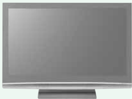
デジタルチューナー内蔵テレビ