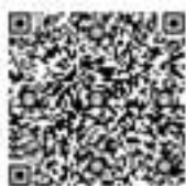
参加申し込みQRコード

9月1日現在、当市に住民票のない方(市外に転出した方、またはそれ以降に転入した方)で、参加を希望する方は、下記問い合わせ先までご連絡くださるか、QRコードから、必要事項を入力し、生涯学習課宛メールアドレスに送信してください。案内状をお送りします。