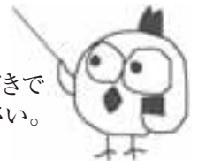
県統計課マスコット 統計トリ子