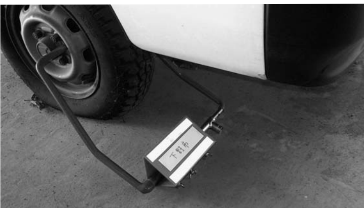
自動車のタイヤロック(H22年度 下野市で実施)