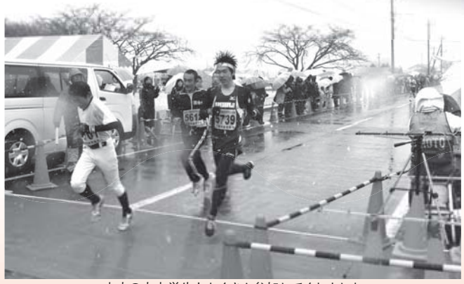
市内の小中学生もたくさん参加してくれました