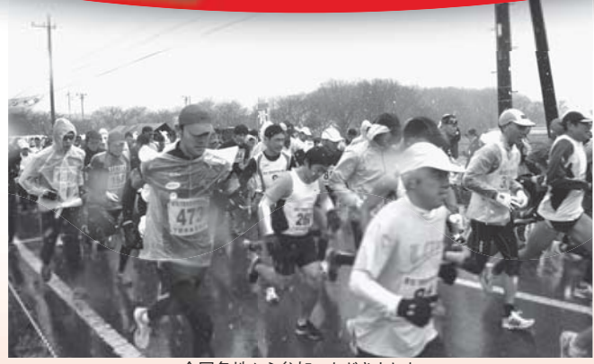
全国各地から参加いただきました