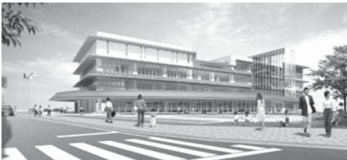
完成予想図(国道4号入口方向より)

昨年着手した新庁舎敷地造成工事や道路などの関連工事は、市民の方々のご理解・ご協力によりまして、概ね順調に進められています。 引き続き、造成工事などの完成に向け工事をすすめて参りますので、ご迷惑をおかけいたしますが、ご理解をよろしくお願いいたします。