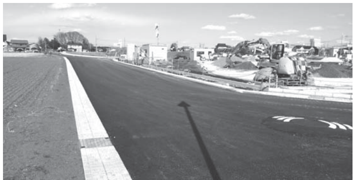
造成工事のようす(敷地南側より1月21日撮影)