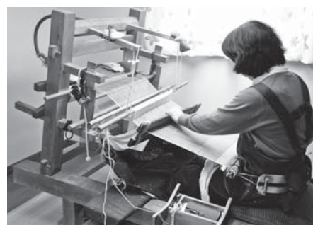
工芸技術 本場結城紬