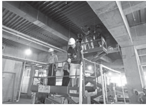
高所作業車の乗車体験

■お問い合わせ先 新庁舎準備室 ☎(40)5568 ■参加ください。 ■次回(28年3月)に完成内覧会を実施する予定です。日程等詳細が決まりましたら広報誌及び市ホームページにてお知らせしますので、ぜひご参加ください。