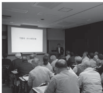
定期歴史講座会場