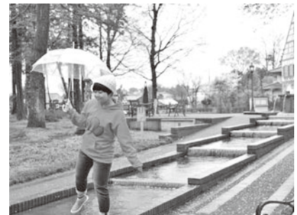
六つ子の末っ子くん (笑)

そんな私が長く続けている趣味が「コスプレ」。小学5年生の時に始めて今でも積極的に行っています。下野市でもコスプレイベントってあるんですよ！実は、先日参加してきちゃいました！どこかわかりますか～?? (*´`*)