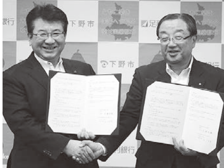
広瀬市長と足利銀行の松下頭取

本協定により、市民が幸福感を感じ、人や企業に選ばれる活力あるまちづくりを推進します。