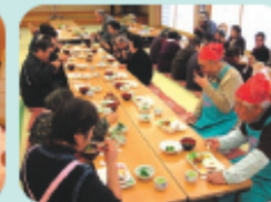
ボランティア「出会いふれあい」