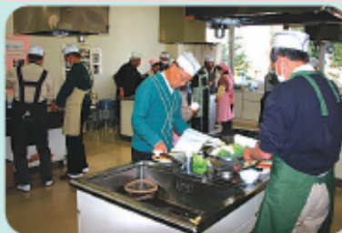
きらら館で調理中