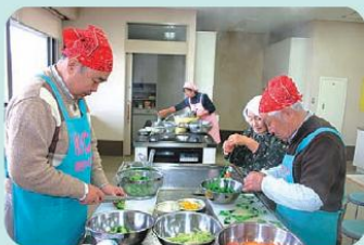
ゆうゆう館にて奮闘中

また、市社会福祉協議会で実施している、70歳以上のひとり暮らしの方対象の「出会いふれあい」においては、ボランティアとして毎月1回2名ずつ交替で、ヘルスメイト2名と一緒に、汁ものと惣菜を提供しています。