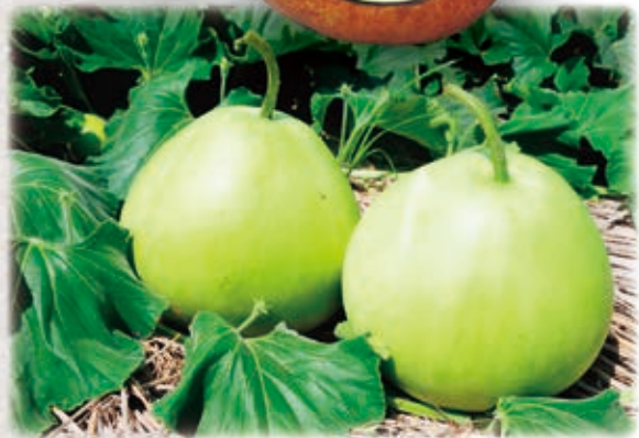
かんぴょうふくべ