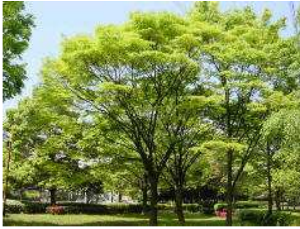
下野市の木 : けやき