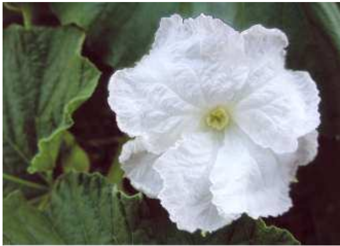
下野市の花：ゆうがお