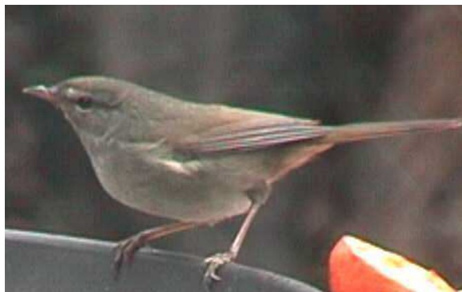
下野市の鳥：うぐいす

今後は、生涯学習を進める市民一人ひとりが学習を通して目標をどの程度到達したかを振り返るよう自己評価を促進するとともに、教育委員会等公的機関などによる評価の仕組みを整え、個人のキャリアアップやボランティア活動、更にはまちづくりに活かしていくことが必要となります。