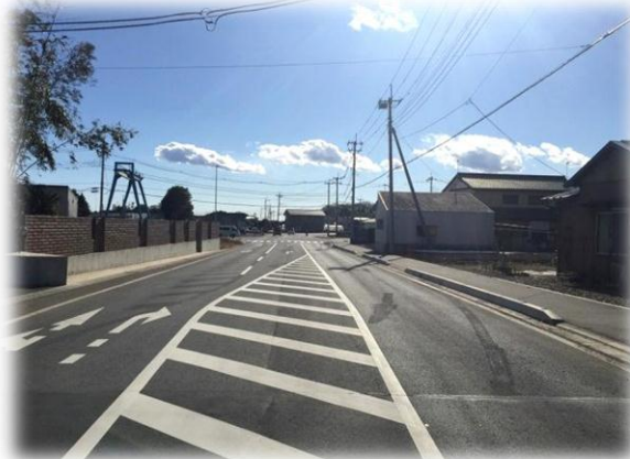
市道 2-10 号線（下長田地内）道路整備