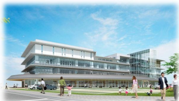
下野市役所新庁舎