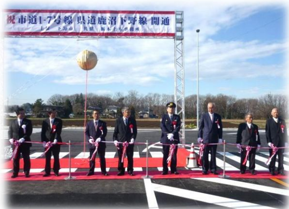
市道 1-7 号線・県道鹿沼下野線（小金井地内）の開通式