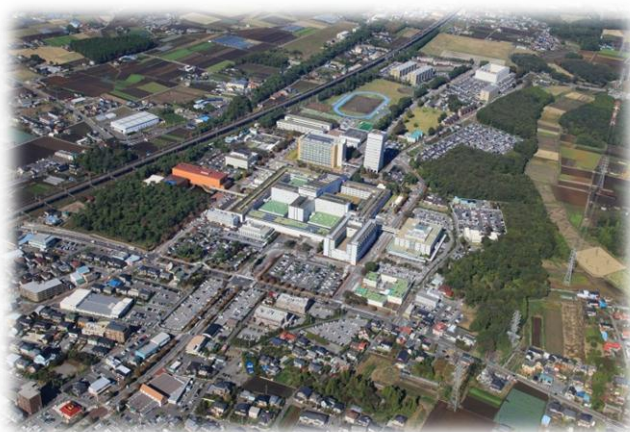
自治医科大学附属病院と周辺の住宅