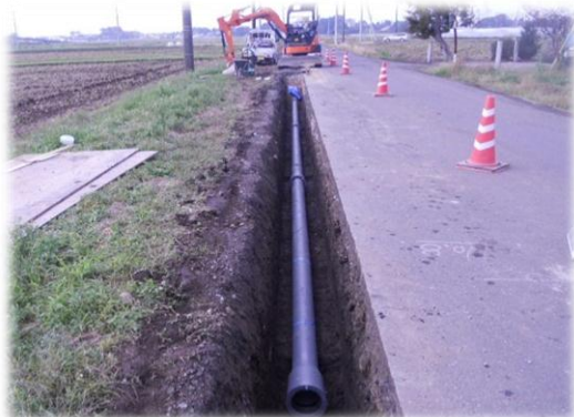
市道 1-7 号線の水道整備