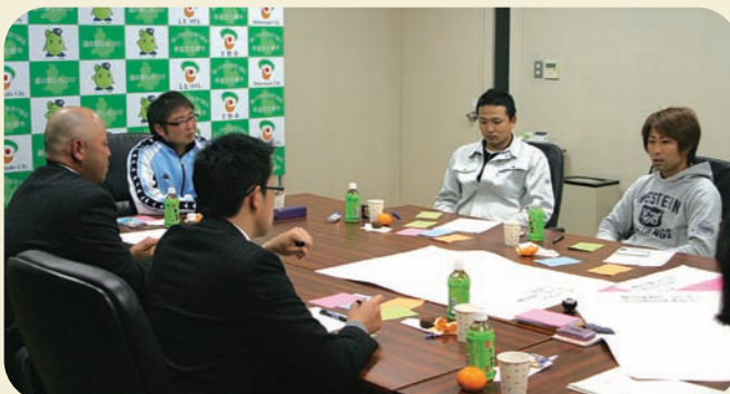
イクメンたちの本音の語り！

終始和やかな雰囲気の中で興味深いお話をいただきましたが、ズバリ、家庭円満の秘訣は「感謝の気持ちと奥様をどれだけねぎらえるか」にあるようです。昨年の震災後、絆の大切さを人は気づき始めましたが、今回のイクメン座談会をとおして、「ありがとうと言える幸せ」「ありがとうと言われる幸せ」という、参加者の皆さんのご家族と子育てに対する温かい思いやりに深く感動いたしました。