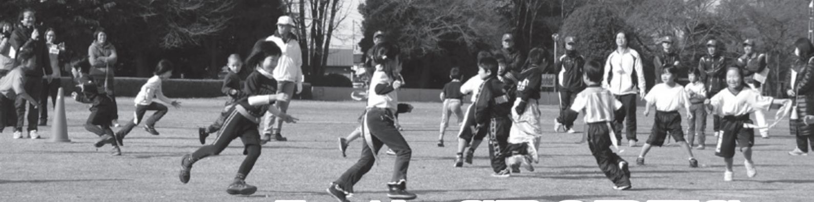
スポーツ少年団SHIPS交流大会(しっぽ取り)