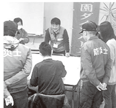
話し合いながら、避難者を各部屋へ割り振りを行います

被災時に一度に大勢の避難者が集まる学校の避難所を想定したもので、避難者情報が記載されているカードをみんなで話し合いながら、迅速かつ適切に避難所の各部屋へ振り分けるゲームを行いました。