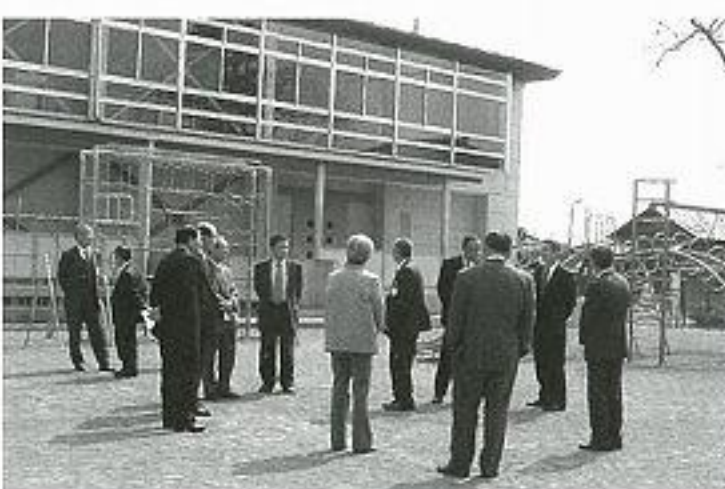
教育福祉常任委員会

では、次世代育成支援行動計画策定のためのアンケート調査結果なども踏まえながら、さらなる拡充を図られたい。 4. ふれあいサロン事業の拡大を図るなど、高齢者の健康と生きがいづくり施策に積極的に取り組まれない。 5. 医療制度が改正され、新たな健診制度に移行される中で、市民が混乱しないような万全の対応を図られたい。