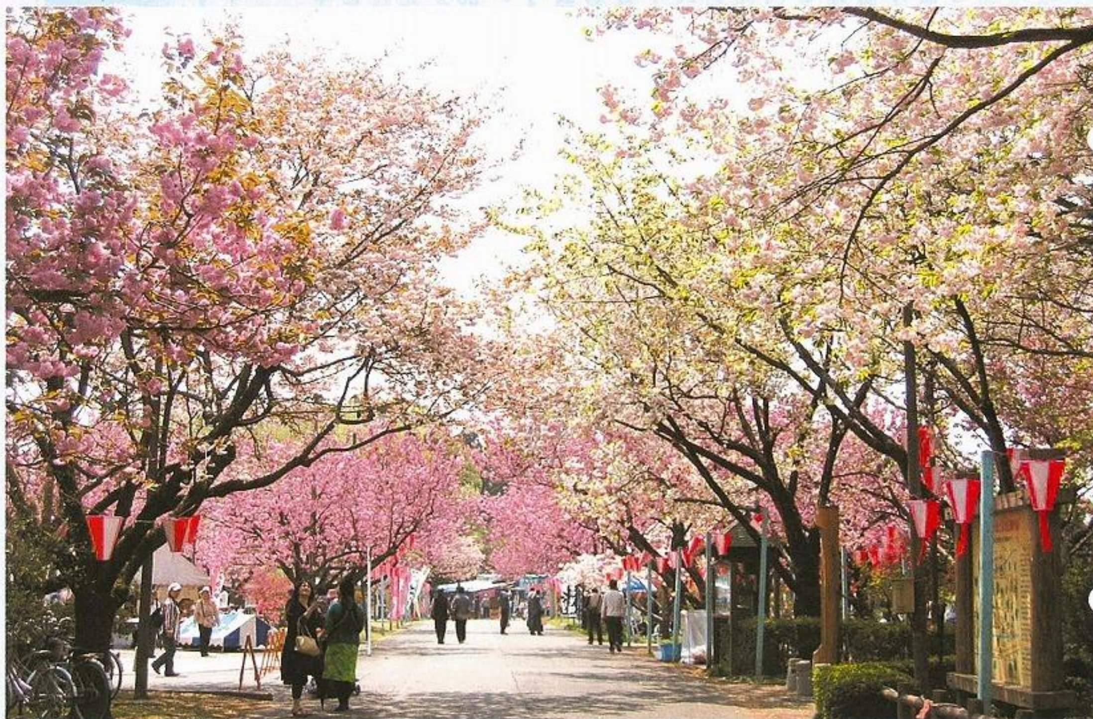
下野市の春「天平の花まつり」盛大に開催

●発行：栃木県下野市議会 ●編集：議会広報特別委員会 ●☎0285-40-5561 FAX0285-40-5567