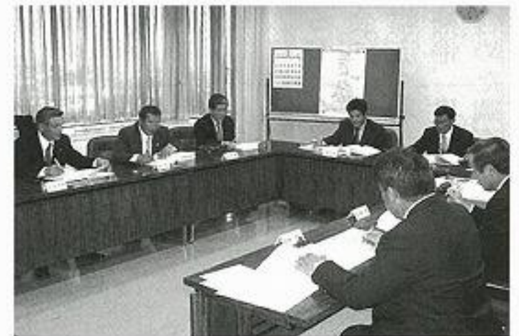
経済建設常任委員会

水道料金の統一に伴う料金の改定に当たっては、(仮称)公共料金審議会等に諮るなど住民の理解が得られるよう十分なる検討を願いたい。また、安定供給のため石綿セメント管の早期更新を図り、今後とも安全でおいしい水の供給に努められたい。