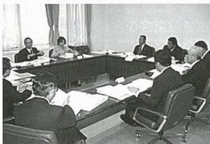
総務民生常任委員会

12. 本年4月より後期高齢者医療制度が創設されるが、制度内容について十分に周知徹底を図られたい。