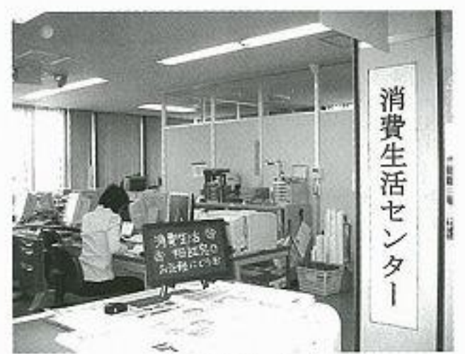
消費生活センター

市長 計画については環境保全率先実行計画策定を目標とし、数値目標の設定において基礎となる基準データ