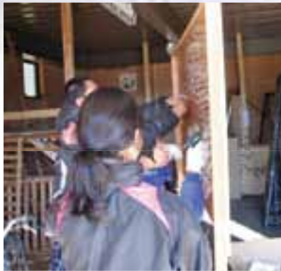
ボランティアによる準備風景

第6回目を数えた「グリムの森イルミネーション」は、グリムの森近隣住民の有志が、入出が鈍る冬季の活性化を目的として、平成21年に「下野市ウインター活性化推進協議会」を発足させて活動をスタートさせました。この協議会は、役員は代表と広報担当のみで、ボランティアの参加と協力による運営となっています。