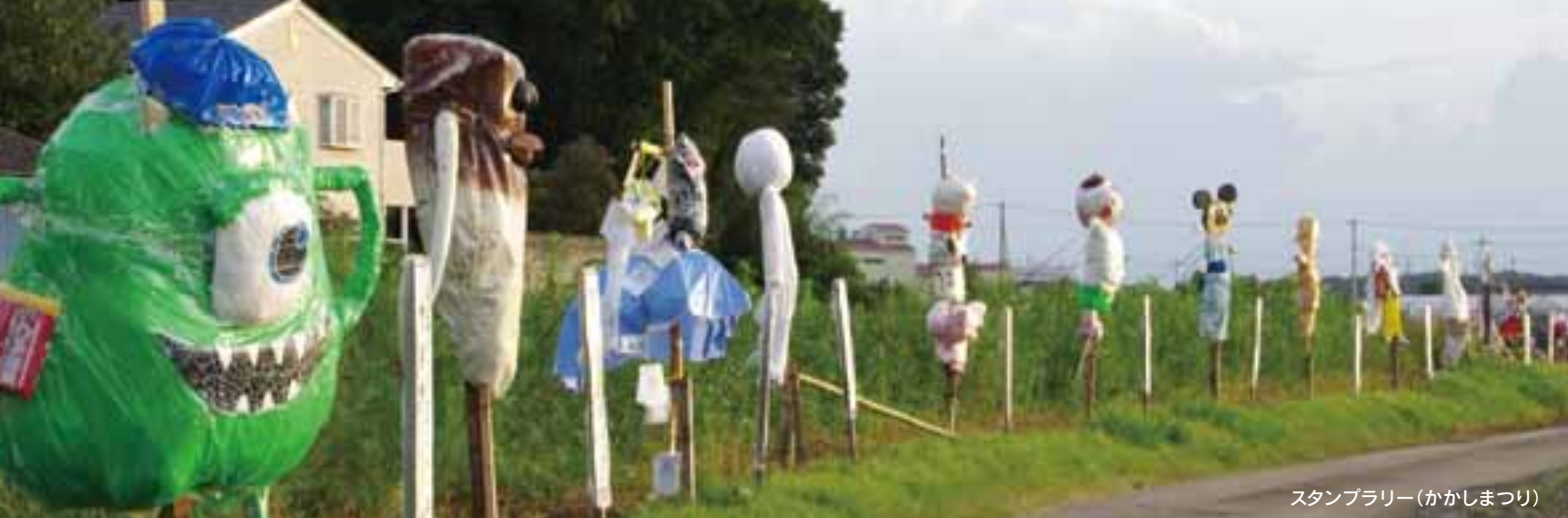
スタンプラリー(かかしまつり)

「いしばしイベントめぐりスタンプラリー」は、下野市市民活動支援事業ができたことを機に、個々に事業展開していた3つの団体が「石橋地区イベントめぐり実行委員会」として協働で取り組んでいる事業です。3つの団体が夏に行うイベントの実施日が近かったことから、同日開催することにしました。