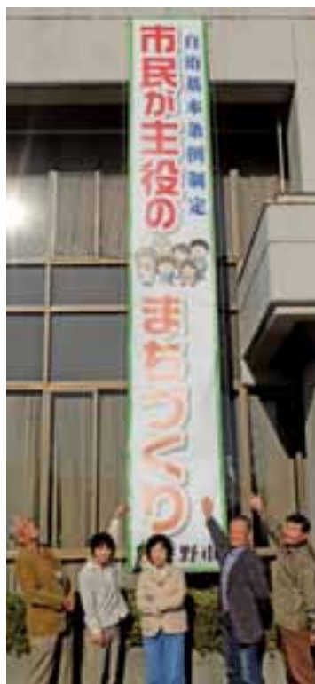
懸垂幕と編集委員

この情報紙を市民と行政そして地域社会の一員である事業所の皆様と協働で作成していく取組として、情報紙「らいさま」に掲載する有料広告を募集します。事業所・企業・自営業等の経営者の皆さん、ぜひこの機会に、下野市のまちづくりの情報紙である「らいさま」に広告を掲載してみませんか？掲載料は1万円から、規格等は広報しもつけに準じます。