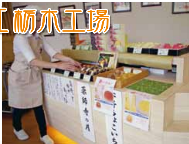
曙フーズ(株) 栃木工場・直営店舗

下野市の木「けやき」にちなんで名付けられたご当地銘品「下野けやき」という米菓や和菓子をご存知の方もいるかと思いますが、曙フーズ株式会社栃木工場は、下野市下坪山工業団地に立地して30年が経っています。本社は東京日本橋にあり、栃木工場では米菓類とお菓子類の大きく2つのラインを保有し、ここで製造された商品は全国80店舗に出荷されています。