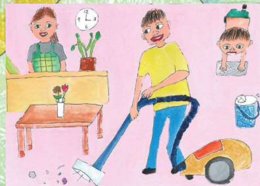
優秀賞 国分寺小5年 西松花歩

✓ チェックの数はどうでしたか? 多かった人、男らしさ、女らしさにこだわっていませんか? でもね、一番大切なのは『自分らしさ』みんなの「~らしさ」を認めあい、思いやりの心を広げましょう。それが男女共同参画です!