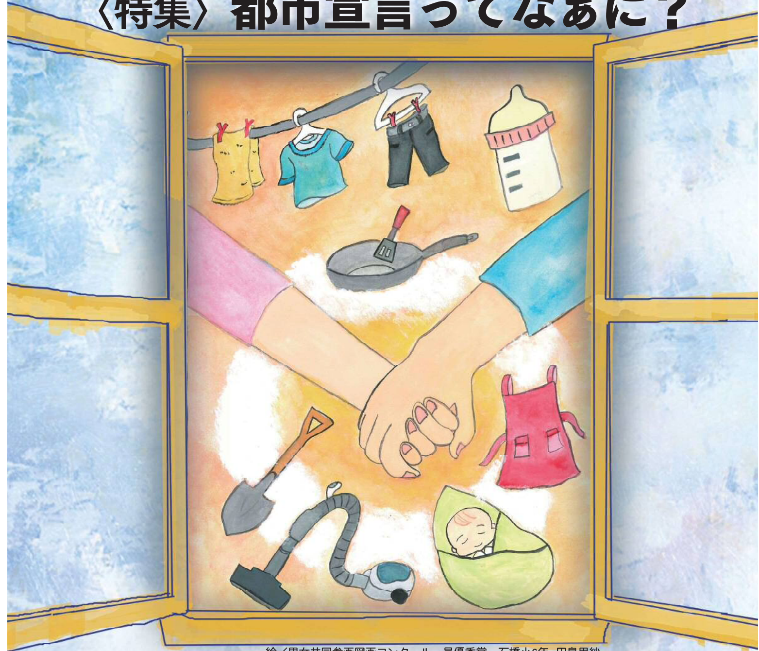
絵/男女共同参画図画コンクール 最優秀賞 石橋小6年 田島里紗