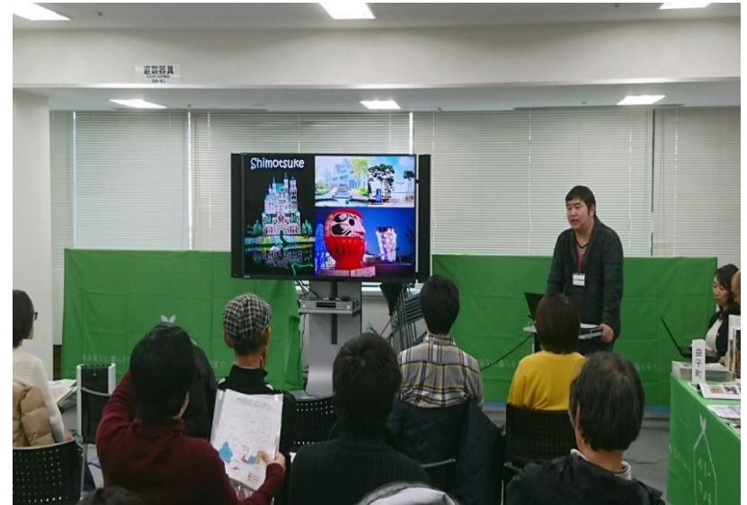
U・Iターン促進のため 東京圏にて移住セミナーを開催