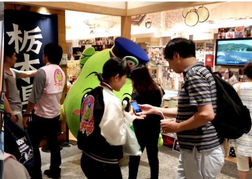
東京ソラマチ（とちまるショップ）