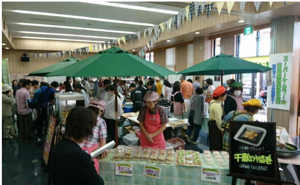
しもつけブランドフェア（道の駅しもつけ）