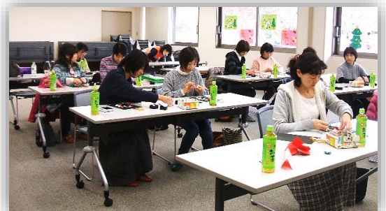
★最後はのりで貼り、素敵なバラの花のマグネットができました。