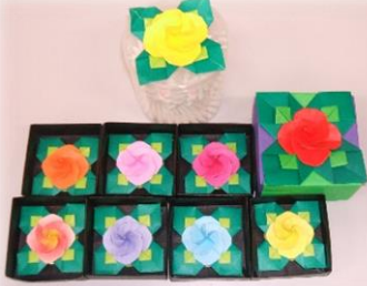
★カラフルなバラの花のマグネットとクリスマスリースを作りました！

5回目の研修会及び交流会を、昨年11月11日（金）ゆうゆう館にて開催いたしました。提供会員12名、依頼会員1名とお子さん1名に参加して頂き、楽しく製作をいたしました。