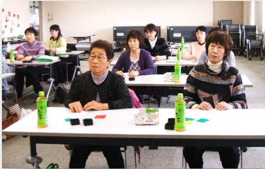
★バラの花を折り、葉っぱを4枚作りました。