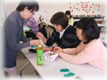
★先生に折り方を聞きました。