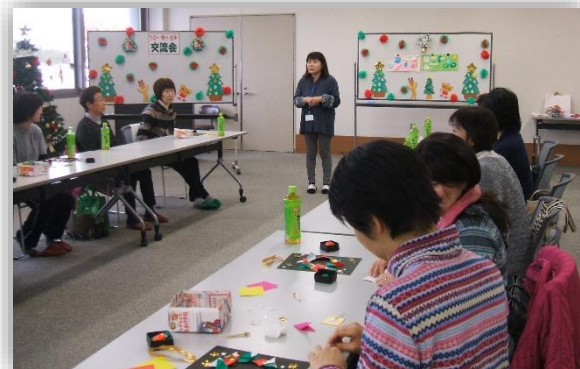
★会員同士のお話に盛り上がりました。