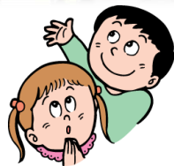
★学校へお迎え～依頼会員自宅