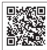
こども救急ガイドブック QRコード

とちぎ医療情報ネット（ http://www.qq.pref.tochigi.lg.jp/ ）内よりご確認ください。