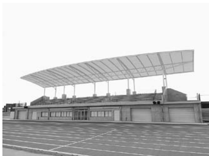
屋根付きの観客席