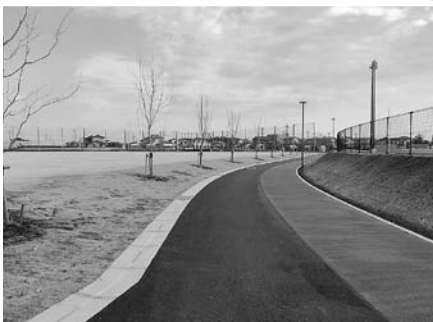
ゴムチップ舗装のランニングコース