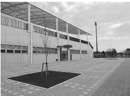
管理棟西側エントランス

大松山運動公園内の施設は、2022年のいちご一会とちぎ国体で会場として利用されます。また、東京オリンピック・パラリンピックの事前キャンプ地としての利用も見込んでいます。