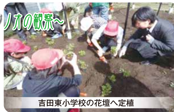
吉田東小学校の花壇へ定植