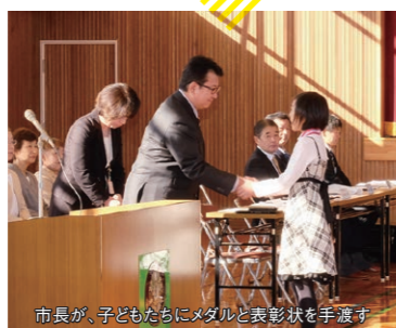
市長が、子どもたちにメダルと表彰状を手渡す

全国に先駆けてスタートした児童表彰。市立小学校に通う6年生全児童に、一人ひとりの良いところを見つけ「健康賞」「親切賞」「明朗賞」など7つの賞を設けて表彰しています。