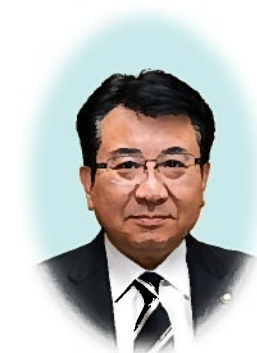
下野市長 広瀬寿雄