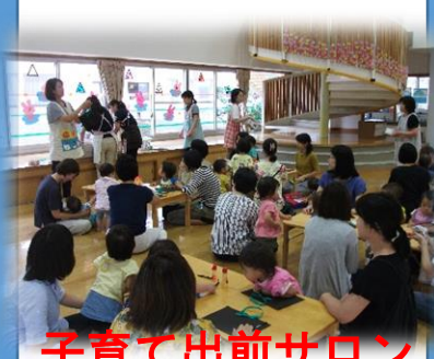
子育て出前サロン