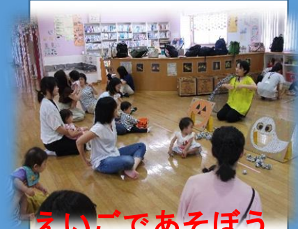
えいごであそぼう