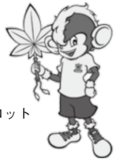
栃木SCのマスコット キャラクター トッキー

※各種イベントの開催は、決定し次第、市ホームページや広報紙などでお知らせします。