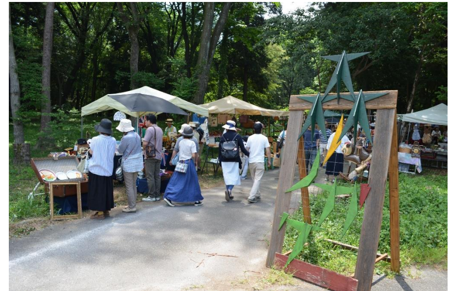
公園を活用したマルシェイベント