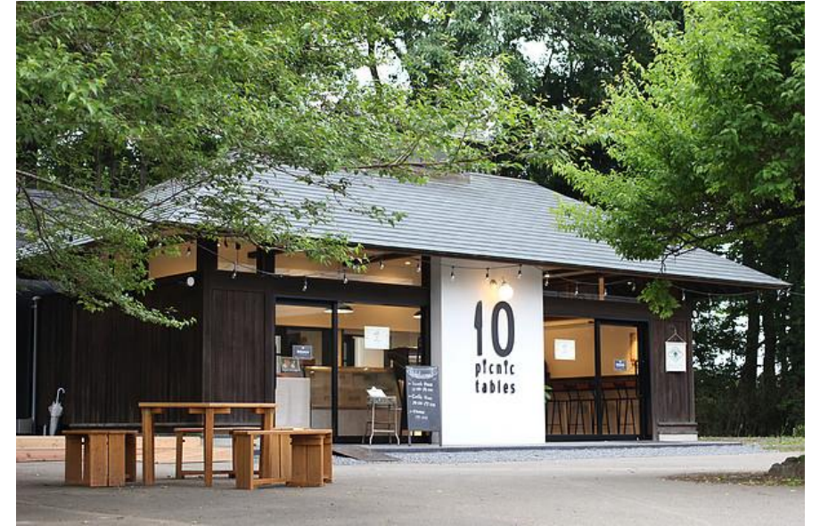
デリカカフェ「10 picnic tables」