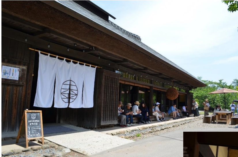
シェアスペース「夜明け前」