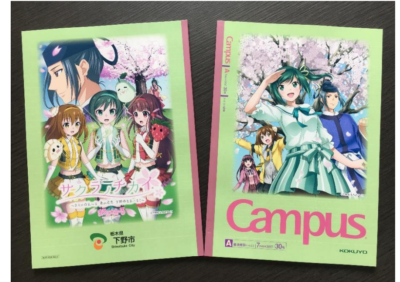
【PR用ノベルティグッズ】 コクヨのキャンパスノート