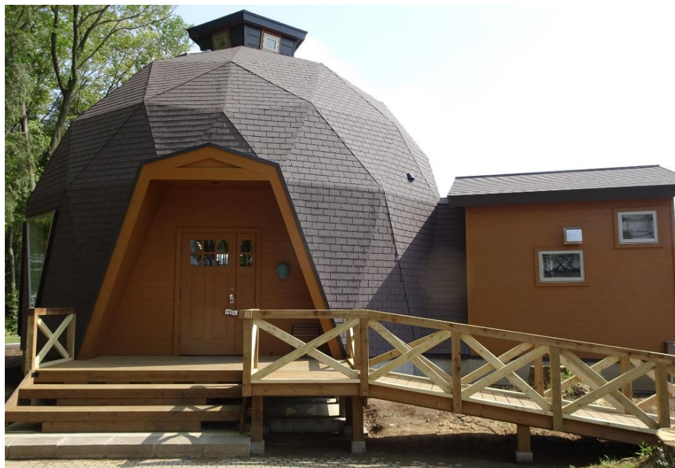
チョコレートをイメージした外観のドームハウス