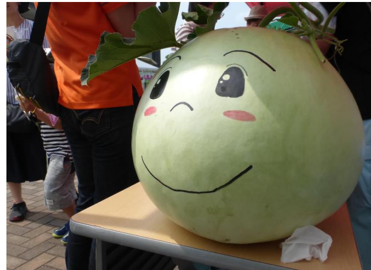
しもつけかんぴょうまつり