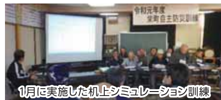
1月に実施した机上シミュレーション訓練

防災組織、地域防災推進員といっても一般人の集まりですから、災害時の対応は慎重を期し、危険を伴う要請はしません。設立当初は組織としてがんばりすぎて上手くいかないこともありました。息の長い自主防災活動を続けるには、背伸びをせずに多くの人に参加しやすいよう敷居を低くすることも大切だと感じました。