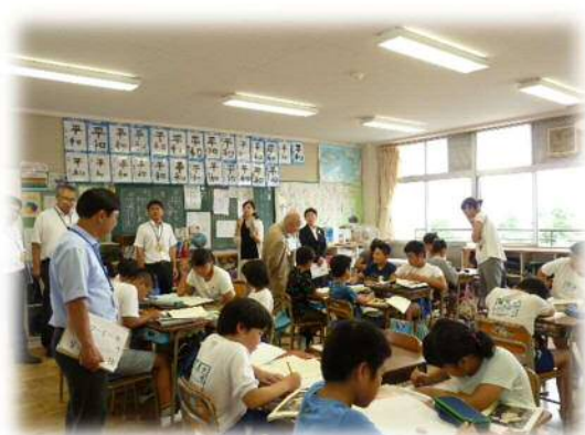
石橋小学校での授業参観