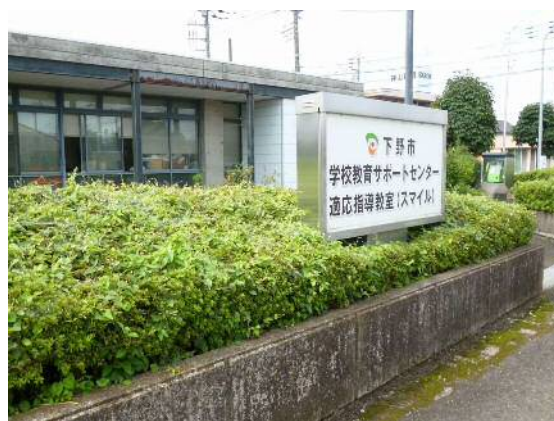
学校教育サポートセンター、適応指導教室(スマイル) 外観