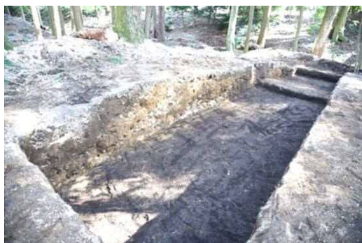
児山城跡 第2郭南東部の土塁