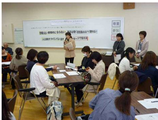
家庭教育支援チーム「ひばり」との連携活動の様子