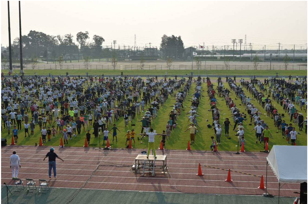
夏季巡回ラジオ体操・みんなの体操会(令和元年8月2日 大松山運動公園陸上競技場)