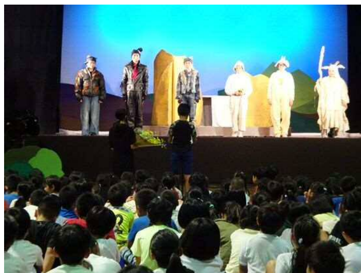
小学校演劇鑑賞会