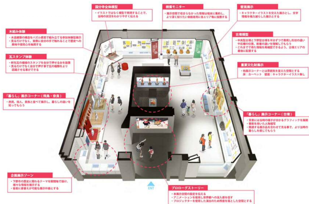
しもつけ風土記の丘資料館 常設展示室イメージ図