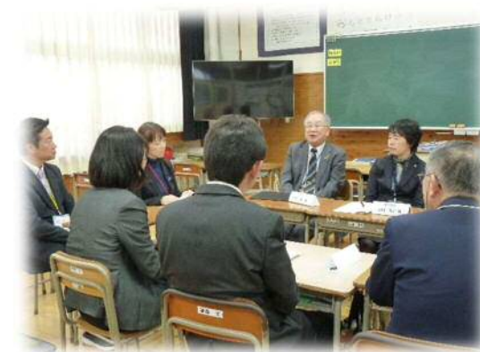
南河内中学校での教職員との懇談