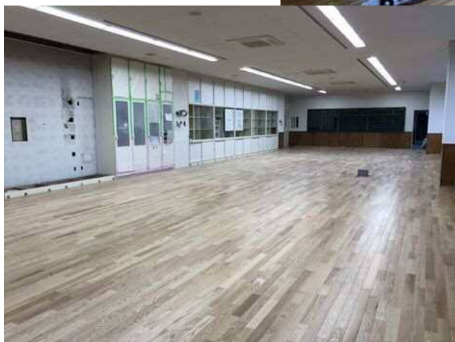
職員室 災害時(右上)・復旧後(左下)