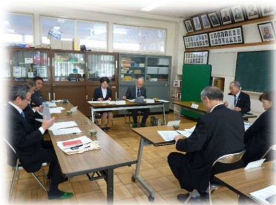
国分寺小学校で開催された出前教育委員会