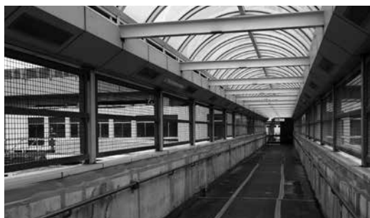
JR小金井駅東西自由通路

プレミアム付商品券発行事業に1,260万円、JR小金井駅東西自由通路修繕事業に6,500万円、自治医大駅周辺整備事業（東口駅前広場整備・シェルター設置）に7,500万円を増額しました。また、東京オリンピック・パラリンピックの開催延期を受け、関連予算702万7,000円を減額しました。