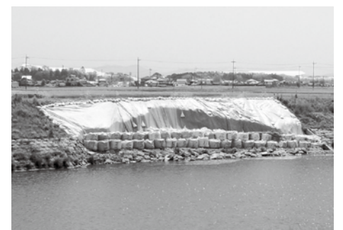
境橋(田川)付近の仮復旧した堤防

答1-2 建設水道部長 県は河川に危機管理型水位計と簡易型河川監視カメラを増設予定。水位計を田川橋、箕輪橋、柳橋、関沢橋付近に、監視カメラを田川橋と柳橋、関沢橋付近に設置する予定。(現在、水位計は谷地賀橋、監視カメラは、箕輪橋、谷地賀橋に設置済み)