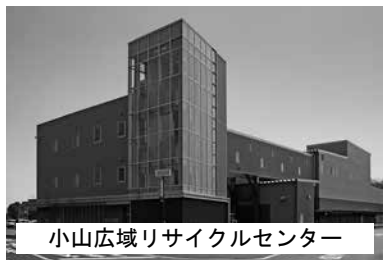
小山広域リサイクルセンター

小山市、下野市、野木町、上三川町の2市2町で組織され、各市町議会から計14名が組合議員に選出されます。し尿処理・ごみ処理に関する施設、斎場及び火葬場の建設や管理運営に関する事務、休日急患診療施設の運営等を共同で行っています。