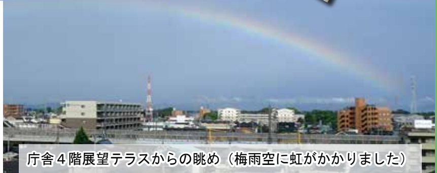
庁舎4階展望テラスからの眺め（梅雨空に虹がかかりました）