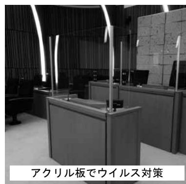
アクリル板でウイルス対策

本会議や委員会の傍聴は控えていただき、本会議のようすは4階ロビーのモニターでご覧いただきました。