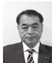
大島 昌弘 議員