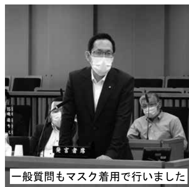
一般質問もマスク着用で行いました