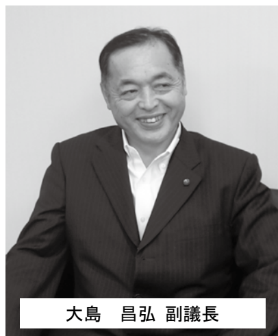
大島 昌弘 副議長