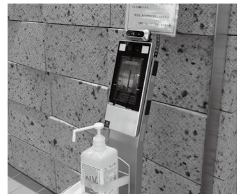
6月22日に庁舎に設置された「体温検知カメラ」

答 2 市長 毎年実施している共通商品券の拡充を図り、プレミアム率を10%から20%に、発行枚数9,000枚を10,800枚とした。市内経済の早期回復の一端となればと思う。また、GoToキャンペーンの効果が十分得られるよう国等に働きかけをしていきたいと思う。