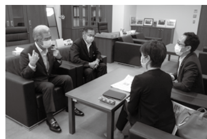
議長室にてインタビュー