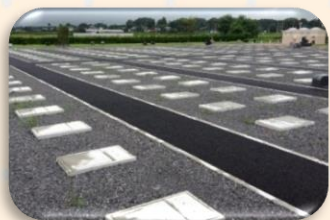
すがた川霊園墓地