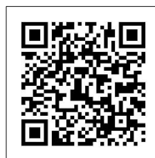
栃木県 HP の QR コード