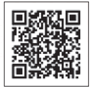
こども救急 ガイドブック

急病やけがの場合の家庭における対処方法や、救急外来を受診する際のポイントをまとめています。