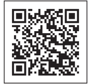
とちぎ医療情報ネット