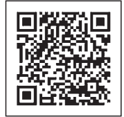
総務省消防庁 Q助案内

( https://www.fdma.go.jp/neuter/topics/filedList9_6/kyukyu_app.html )