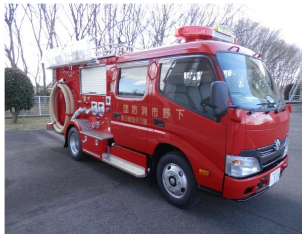
消防ポンプ自動車整備(第3分団第3部)