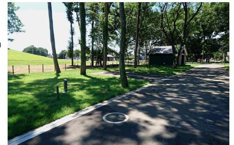
三王山地区公園整備