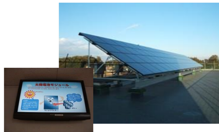
学校太陽光発電施設(国分寺東小)