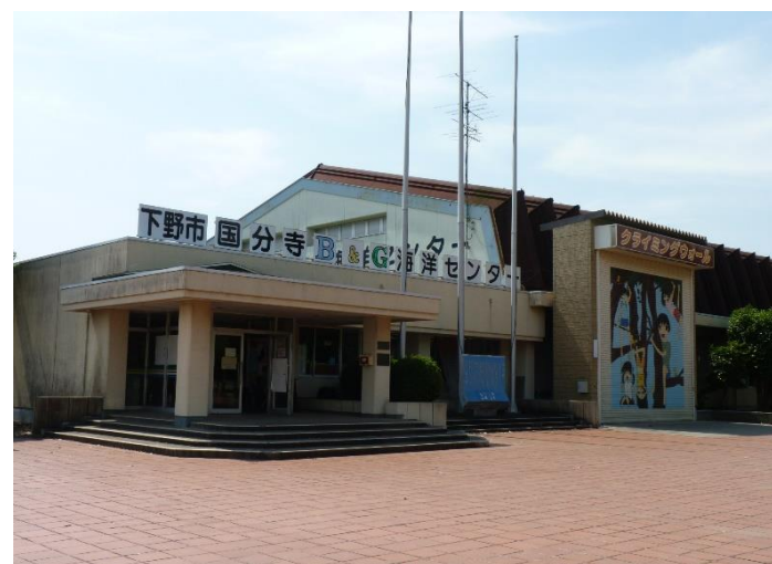
国分寺B&G海洋センター改修事業