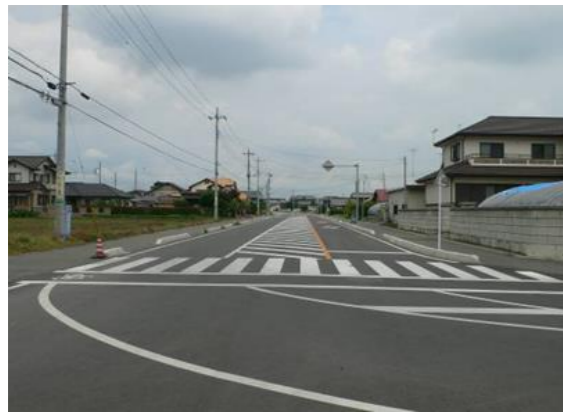
仁良川地区土地区画整理事業