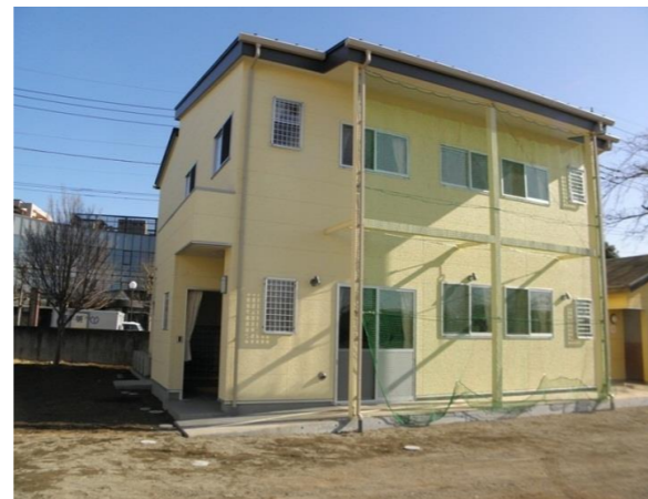
国分寺小学童保育室整備