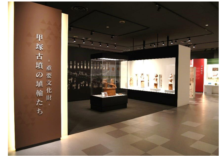
しもつけ風土記の丘資料館整備事業