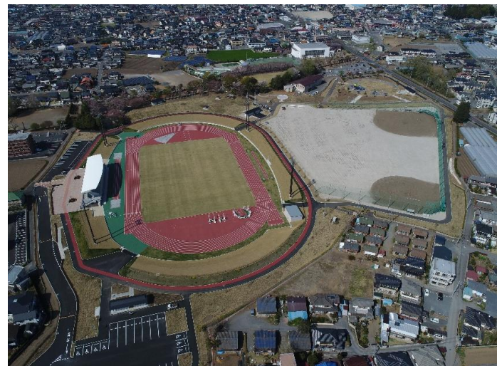
大松山運動公園拡張整備事業