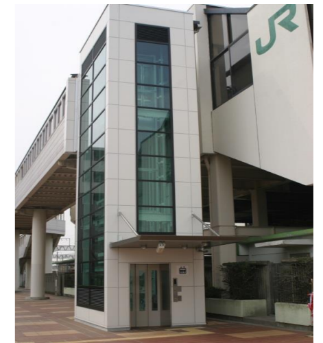
自治医大駅東口エレベーター