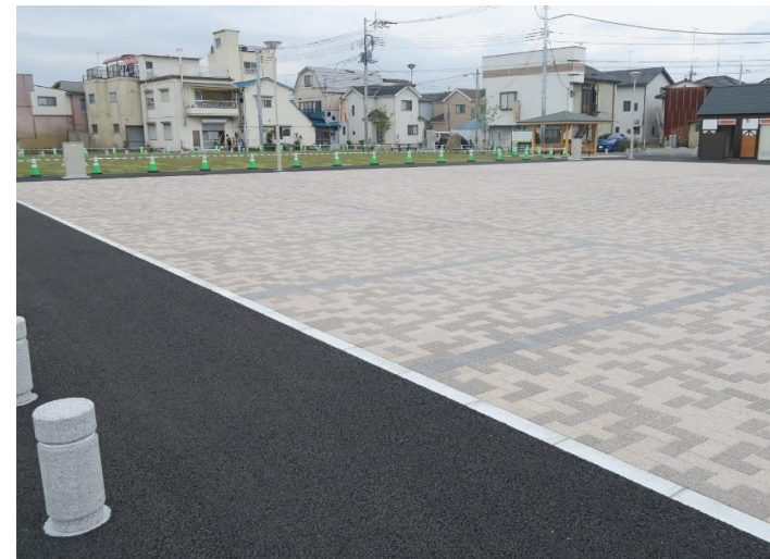
石橋多目的広場整備事業