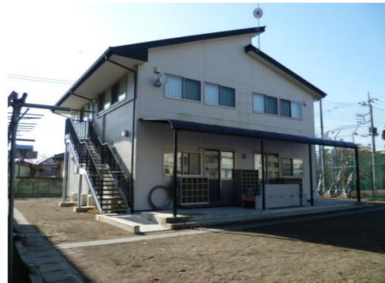
薬師寺小学校学童保育室