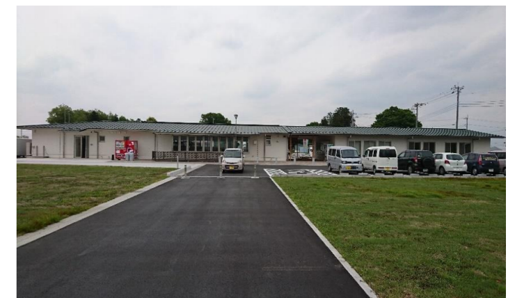
石橋地区都市農村交流施設(ゆうがおパーク)