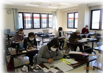
「つくし会」活動風景