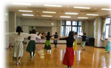
「ミリミリフラ」活動風景