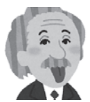
アインシュタイン (物理学者)