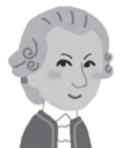
モーツァルト (音楽家)

1つのことにこだわり続けたことで、新たな発明や発見をしたり、注意力が散漫なことが、逆にユニークな発想をもたらしたりする場合があります。