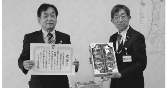
小山農業協同組合