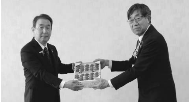
宇都宮農業協同組合

JA栃木中央会では「地元特産品を利用した食育応援事業」として、食への関心、食を支える農の役割を感じてもらおうことを目的として、学校給食へのいちごの提供を実施しています。