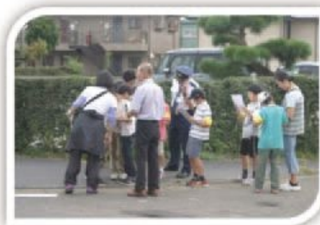
市民活動団体による「地域安全マップ」づくり

市民が主役のまちづくりを推進するためには、それを担う人づくりが必要であり、その育成支援と環境（場所、機会、仕組みなど）づくりに努めます。