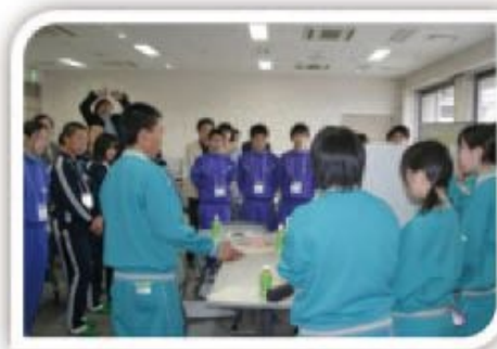
庁舎建設 中学生ワークショップ

下野市の未来を担う子どもたちを「地域の宝」として大切にし、子どもがまちづくりに参画する機会を積極的につくります。