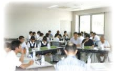
自治基本条例検討委員会 (生徒、学生との意見交換)