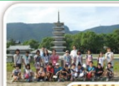
香川県高松市との国内交流

様々な分野で国際交流活動に努めるとともに、多文化共生社会の視点に立った国際感覚豊かなまちづくりを推進します。